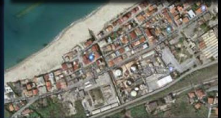
Vibo Valentia quartiere legale come da PRG